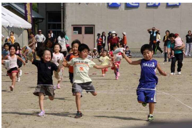
▲曾慶地区民運動会