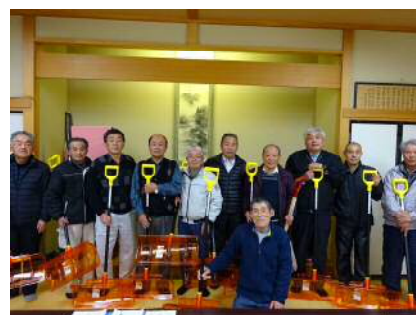
▲高齢者世帯環境チーム H29年雪かき隊設置1年目