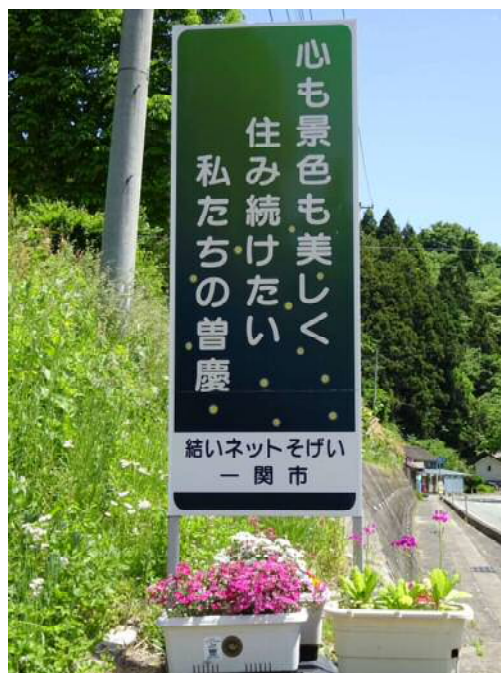
▲神蔭看板と花いっぱいプランター