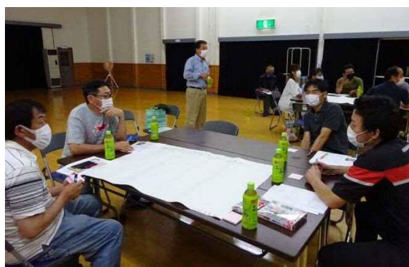
▲若者チーム組織化事業におけるワークショップ