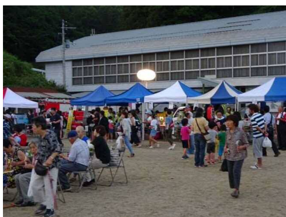
▲14年ぶりの復活！そげい夏まつり