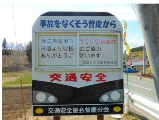
▲曾慶地内交通死亡事故 6500 日継続中