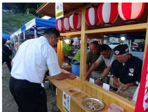
▲特産品開発チーム そげい夏まつり出店