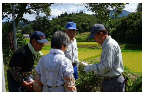
▲花いっぱいチーム 剪定教室